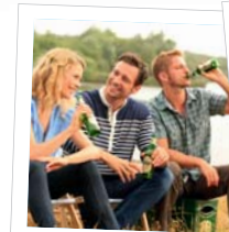
Genau mein Bier?

www.wangerooge.de • Telefon 0 44 69 - 9 90