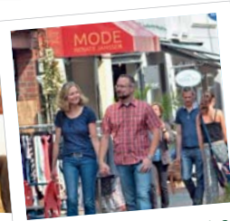
Genau meine Stadt?